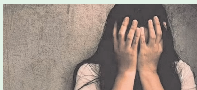
హైదరాబాద్ - ప్రజాజ్యాల ప్రతినిధి

మనదేశంలో మహిళలకు భద్రత లేదా? విదేశీ మహిళలు దాడులు ఎదుర్కొంటున్నారా? మొన్న కర్నూట గంగావతిలో జరిగిన దారుణమే, ఇవాళ హైదరాబాద్ శివారు లో జరిగింది. ఆ ఘటనకు సంబంధించిన వివరాలు ఇలా ఉన్నాయి. ఈ స్టోరీను ఓ సారి లుక్మేయండ్ మరీ, హైదరాబాద్ లో జర్మనీ యువతిపై అత్యాచార ఘటనలో దర్యాప్తు జరుగుతోంది. ఎయిర్పోర్టుకు వెళ్తున్న యువతికి లిప్ట్ ఇస్తామని చెప్పి కార్లో ఎక్కించుకున్నారు ముగ్గురు యువకులు. మీరీపేట్ దగ్గరలోని మండపల్లె మార్గం.. సదరు యువతిని కారులో ఎక్కించుకుని తీసుకెళ్లి అత్యాచారానికి పాల్పడ్డారు. పహాడీ షరీఫ్ పీఎస్ లో ఫిర్యాదు చేసింది ఆ జర్మనీ యువతి. ముగ్గురు యువకులు తనపై లైంగిక దాడి చేశారని ఫిర్యాదు చేసింది. మీరీపేట్ దగ్గర లిప్ట్ ఇస్తామని చెప్పి వాళ్లు కార్ ఎక్కించుకున్నట్లు ఆమె కంప్లైంట్లో వివరించింది. తర్వాత పహాడీ షరీఫ్ ప్రాంతంలోని నిర్మాణవ్య ప్రదేశానికి తీసుకెళ్లి ఆమెను బెదిరించి లైంగిక దాడికి పాల్పడ్డారు యువకులు. సీసీ ఫుటేజీ ఆధారంగా నిందితుల్ని గుర్తించేందుకు ప్రయత్నిస్తున్నారు పోలీసులు. ఇప్పటికే ఒక నిందితుడిని అదుపులోకి తీసుకున్నట్లు సమాచారం. బాధితురాలు విదేశీ యువతి కావడంతో కేసును మరింత సీరియస్ గా తీసుకుని దర్యాప్తు చేస్తున్నారు. బాధిత యువతిని వైద్య పరిక్షల కోసం హాస్పిటల్ కు తరలించారు పోలీసులు.