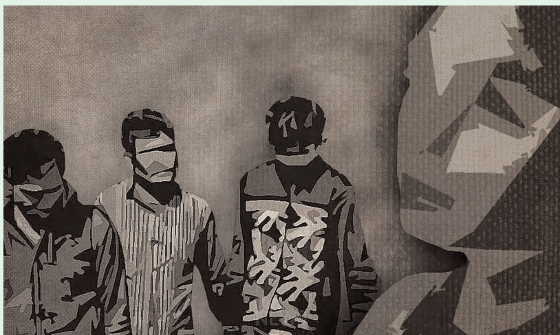
నాగర్ కర్నూలు- ప్రజాజ్యాల ప్రతినిధి