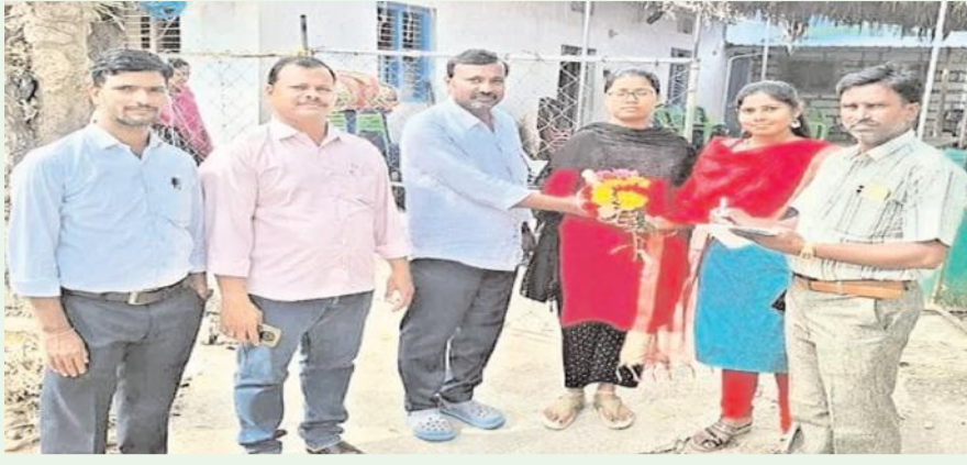
హైదరాబాద్ - ప్రజాజ్యాల ప్రతినిధి