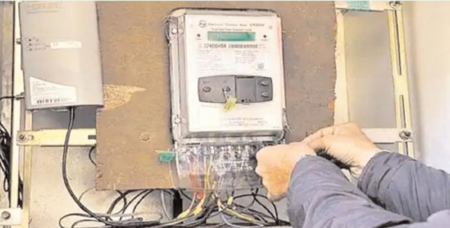
హైదరాబాద్ - ప్రజాజ్యాల ప్రతినిధి